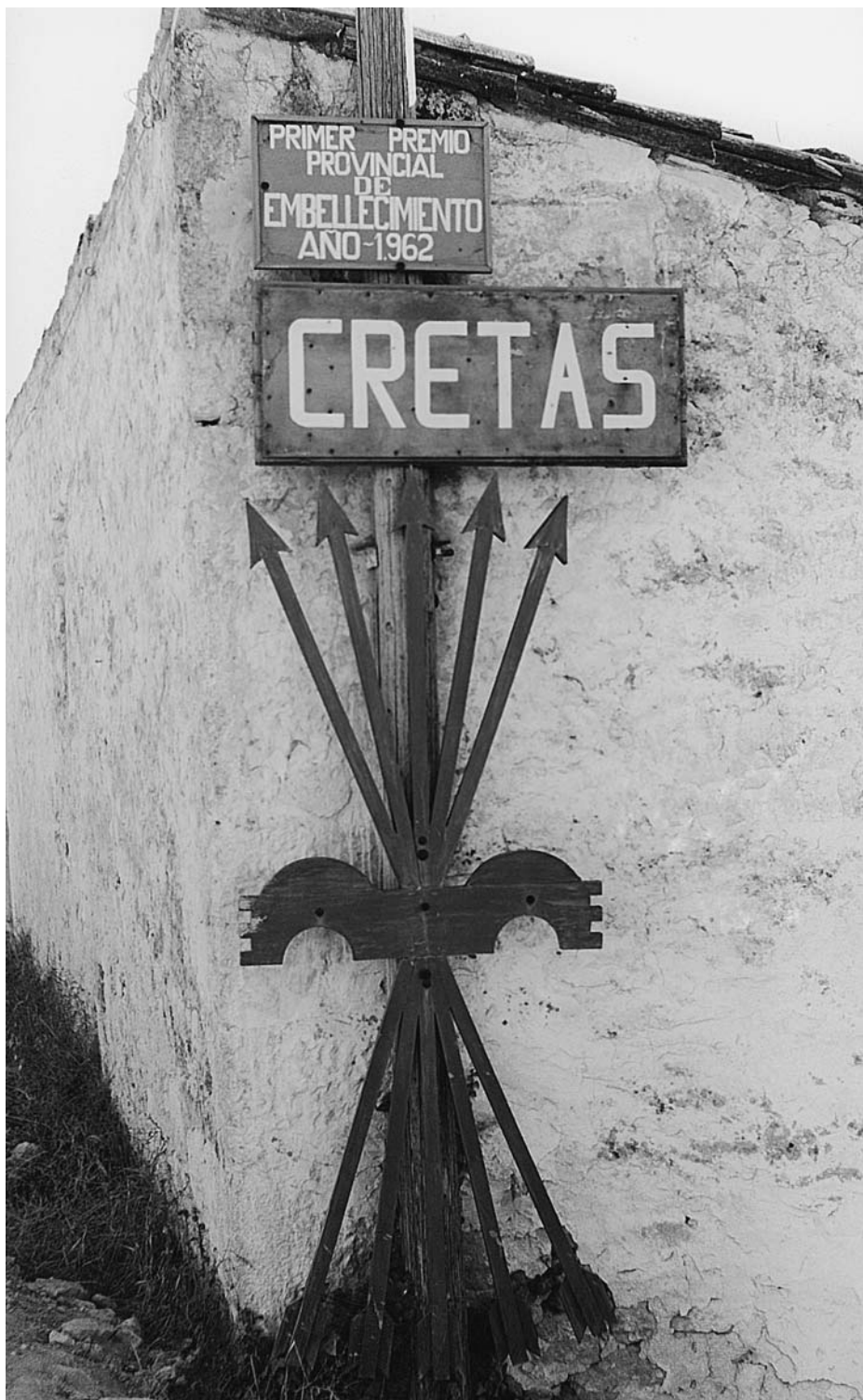
El yugo y las flechas. Queretes, 1967.