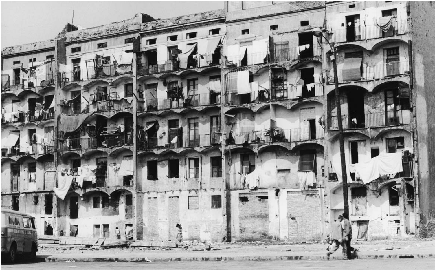
Cases del Barri Xino, Barcelona, 1968.