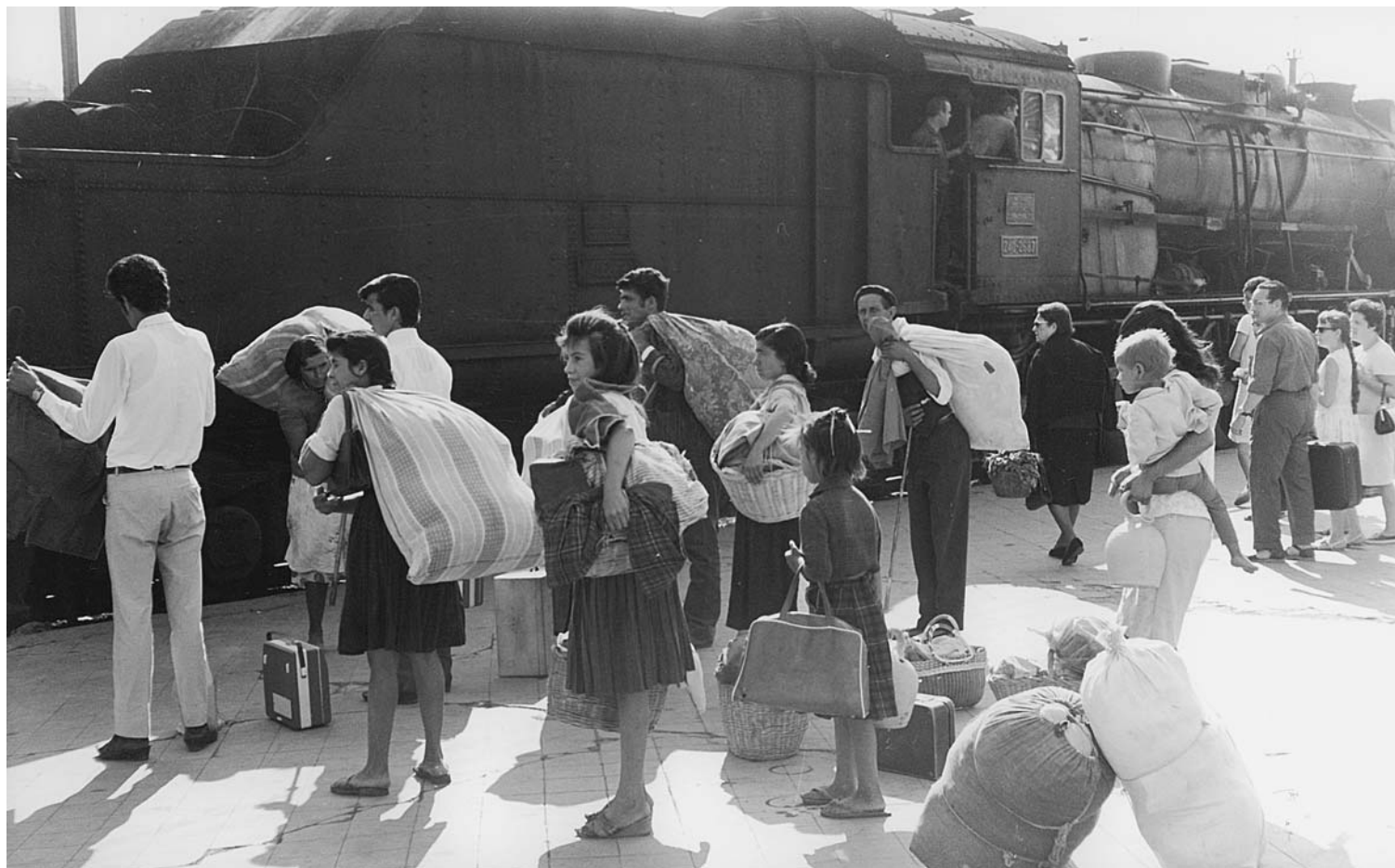
L'estació de Móra la Nova, 1967.