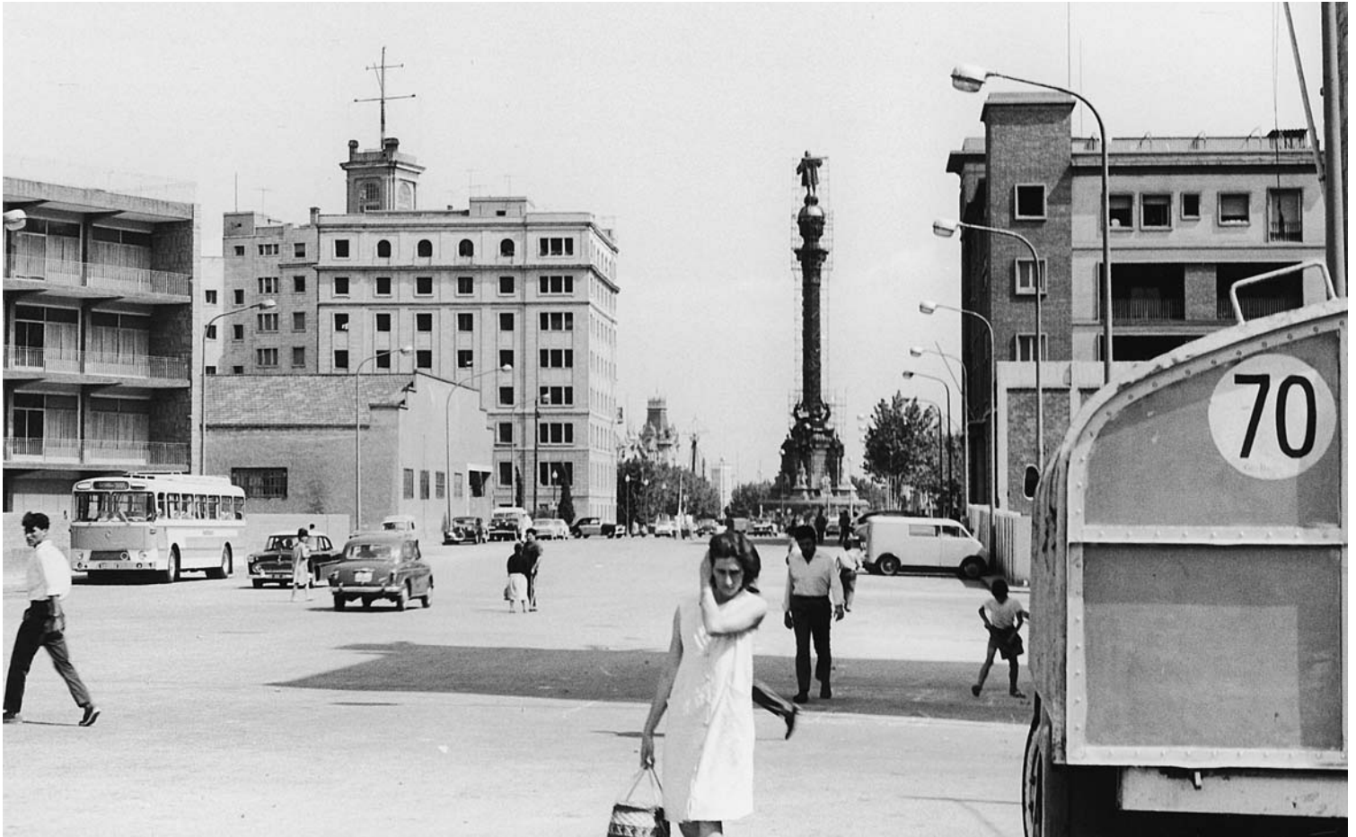
La Rambla. Barcelona, 1968.