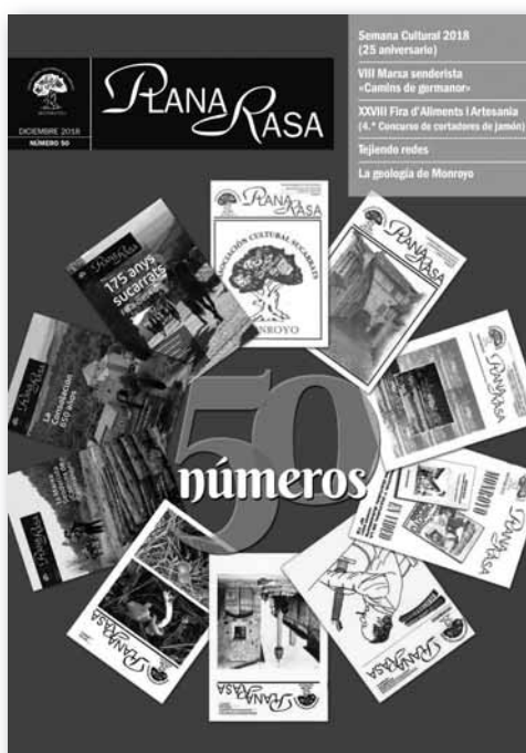
Portada del número 50 de Plana Rasa

En el primer número escrivien els socis responsables de la publicació els objectius per a editar la revista i que l'han mantingut en molt d'es-