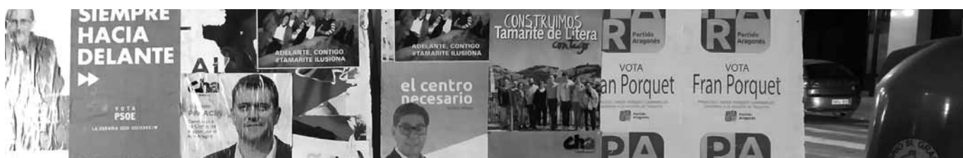
Càrtells electorals a la Llitera. JOSEP ESPLUGA

També cal esmentar l'aparició d'un nou partit independent, 'Albelda Contigo', una escissió del PSOE encapçalada per l'antiga alcaldessa, que ha revalidat el càrrec amb la nova formació.