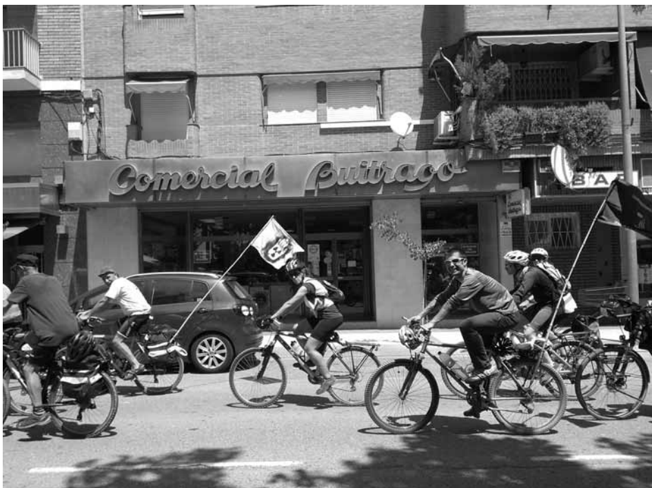
IX Ecomarxa celebrada a Fraga REDACCIÓ

Tot això ho sabien les persones que van arribar a Fraga i és veritat que el grup era molt divers. El primer dia van fer un recorregut circular entre Fraga i Mequinensa, on van veure la riquesa de la fauna i la