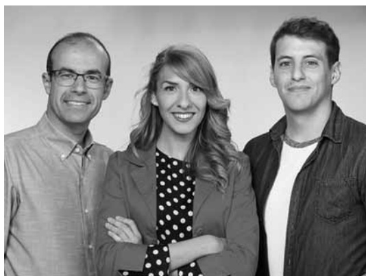
Els presentadors de Charrín, Charrán ARAGÓN TV