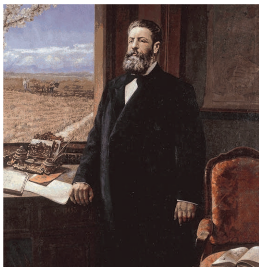
Retrat de Joaquín Costa de 1913, obra de Victoriano Balasanz

polític i social a Espanya per al progrés agrícola. La vida espanyola es basava en aquells temps en l'economia agrícola, per això devia ser important l'acció política i la regulació dels rius per poder distribuir l'aigua mitjançant grans canals.