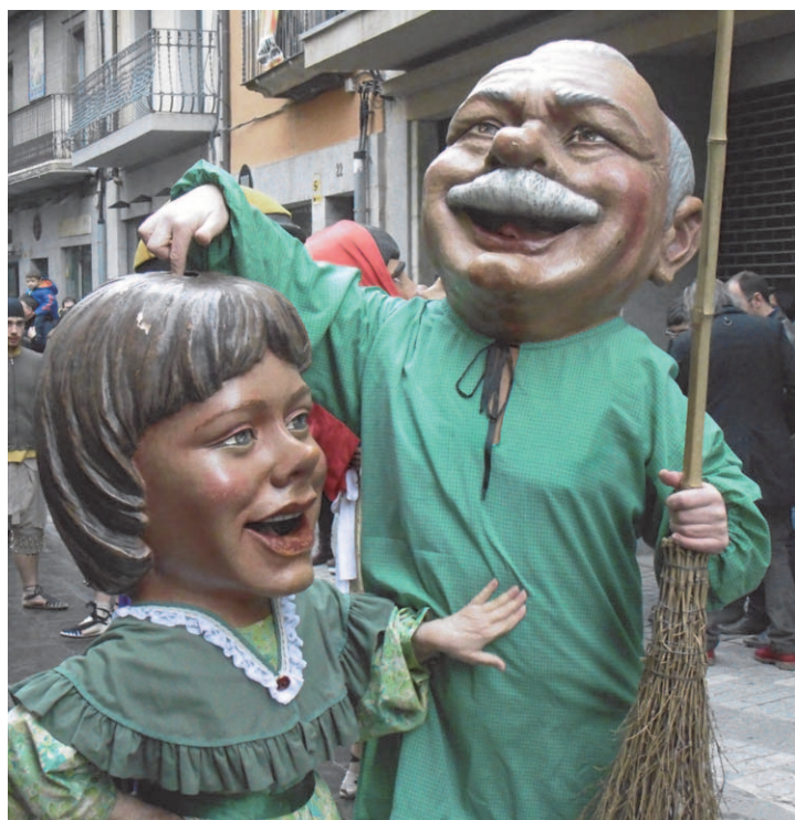
Capgrossos al cercavila de Girona ELENA CEBRIÁN

Des de la galeria central del pis més alt del mercat, un jove abillat amb un davantal de peixater (una mena de fish-jockey) punxava discos mentre a baix, la gent, bressolada pel seu ritme, prenia ostres, un muntat de salmó, formatges o embotits del país.