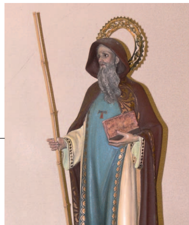
Sant Antoni Abat

els del Camp, mil·lenaris al costat del Monestir d'Alaó, i, fins i tot, s'ha plantat oliveres d'arbequina al terme. Les hortes que tenien un bé de Déu de tiberi, poc a poc van desapareixent per falta d'agricultors –tot dona més que un tros de terra de minifundi–. Es continuen sembrant aquells trossos que presenten més productivitat pels qui encara tenen granges d'animals i necessiten tenir ple el graner. Què menjarem d'ací uns anys si les terres properes es van quedant ermes? Caldrà esperar el dia que passa el venedor de la fruita, que porta una mica de tot...?