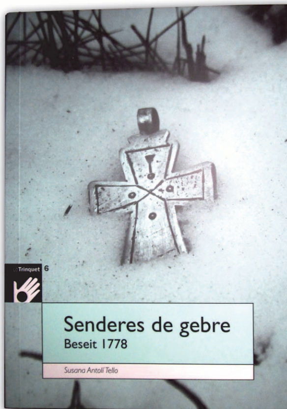
Coberta de Senderes de gebre CARLES TERÈS

Senderes de gebre. Beseit 1778 , amb la revista Turolenses núm. 5 de l'Institut de Estudios Turolenses publicada per les entitats culturals