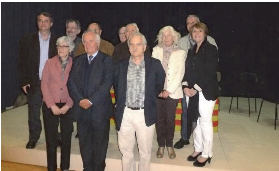
Taula redona 'Llengua i Territori' celebrada a Calaceit el 2013

Un dels moments en què va prendre especial protagonisme va ser al Concert de la Llibertat, l'any 2013, quan l'independentisme va omplir el Camp Nou. “Som aquí per construir un país més lliure, més just i