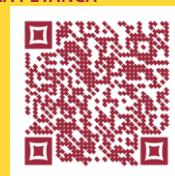
Timó / Farigola (CATALÀ)