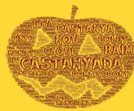
"Logo" fet pels alumnes de català de La Vall amb el programa Word Art Tagul.

A les escoles de Calaceit, Massalió i la Vall del Tormo del CRA Matarranya hem preparat a les aules