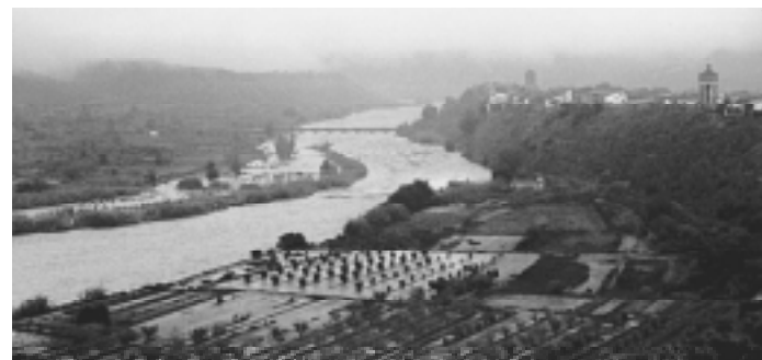
El Matarranya al seu pas per Nonasp durant la riuada de l'octubre

Per altra banda, el President de la CHE, durant una visita al Matarranya, va estimar en 3.000 milions de pessetes les perdudes, de les quals s'haurà de fer càrrec l'Estat i el Govern Autonòmic.