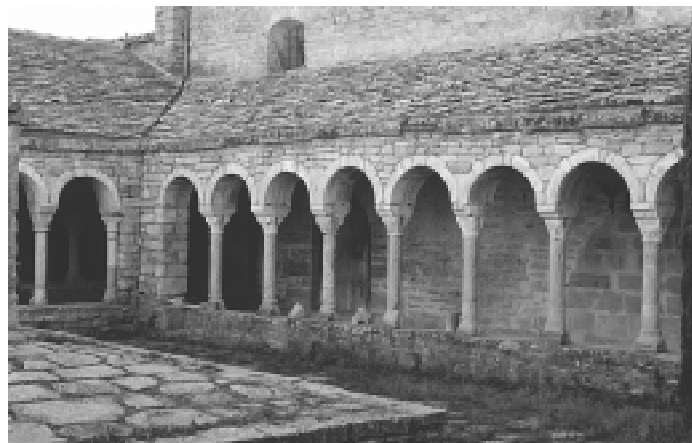
Claustre del monestir de Roda d'Isàvena

«L'estructura estatal unitària basada en els compartiments provincials ha anat arrelant amb força entre els eclesiàstics, i hom va tornar a plantejar la qüestió dels límits diocesans que, respectuosos amb el passat i el present, no seguien les directrius cartesianes. El concordat de 1953 establia la necessitat d'adequar les jurisdiccions diocesanes a les civils, i semblantment el Vaticà II, en termes més generals, a fi d'estalviar problemes i conflictes. En aquestes circumstàncies, sempre condescendents, dóna la impressió que els bisbes de Lleida s'haguessin acontentat amb una certa complaença i un cert immobilisme, i no s'hagués pres cap iniciativa política, com ara la de recuperar l'històric títol de bisbes de Roda, cosa que sens dubte hagués apaivagat els ànims.