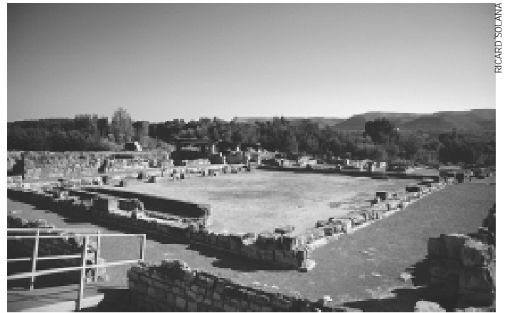
Vista general de Vil·la Fortunatus

Els treballs de conservació i consolidació del que ja ha afloirat a la superfície en aquest jaciment abandonat des de fa gai-