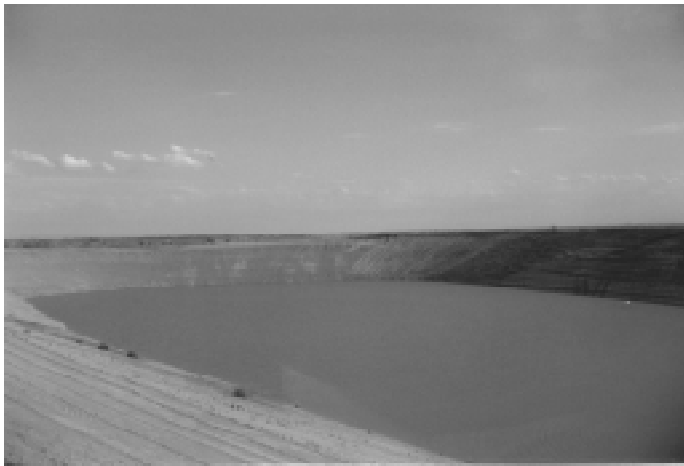
Embassament de Sant Joan al terme municipal de Tamarit de Llitera

La Comunitat de Regants del Torricó està treballant en les obres de modernització dels regadius de les partides del «Vedadet» i «Sant Bartomeu». El projecte de millora afecta a 160 hectàrees que s'han acollit a la iniciativa d'un total de 300 hectàrees i s'espera que al llarg del desenvolupament de les obres s'afegeixin nous pagesos.