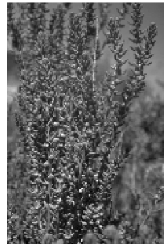
La Salada, planta comú al Vedat de Fraga

Al Vedat de Fraga es pot observar al fons de barrancs salins i una mica humits, acompanyat de la sosa o salat blanc ( Atriplex halimus ) o el tamarí ( Tamarix africana ). Un bon punt d'observació d'eixes espècies és la Vallcorna, barranc que recentment es fa servir de alcabó on desaïguen els excedents dels regs. El canvi de cabdal i de qualitat de l'aigua pot estar afectant al terra i a eixes espècies... un tema a seguir pels que estiguen preocupats pel medi ambient.