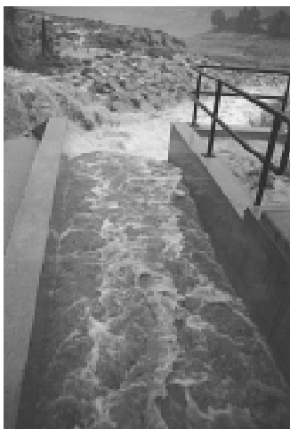
Entrada d'aigua pel túnel que deriva aigües des del Parrissal de Beseit el dia 23 d'octubre de 2000

La CHE no té encara una decisió presa i el seu president ha anunciat que, una vegada estigues acabat el projecte de la Freixneda-la Torre, es reunirà amb els representants de tota la conca per a decidir quina obra es porta a terme. La decisió marcarà el futur del Matarranya.