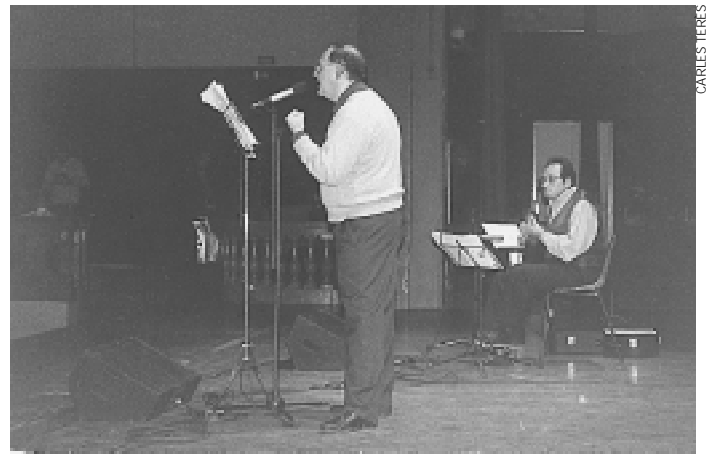
El duo Recapte, en un moment de la seua actuació

El vessant turístic va ser representat per un stand de l'empresa Senda de Beseit, que va repartir fullets informatius i assessorà als assistents sobre les possibilitats d'allotjament i excursions pel Matarranya.