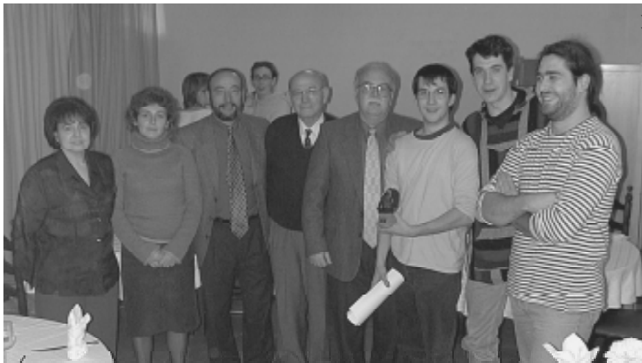
Els guanyadors del primers Premis Jaume I de la Franja

Els Premis Jaume I, amb una important trajectòria al País Valencià, han tingut enguany i gràcies als Casals Jaume I de la Franja la seua primera Gala a les nostres comarques. Ha estat aquest 2 de desembre i a Fraga on, al llarg d'un sopar ple d'emotius parlaments, es lliuraren els reconeixements a aquelles persones i col·lectius que han contribuït a dignificar la nostra cultura o l'avenç dels drets socials i moviments cívics.