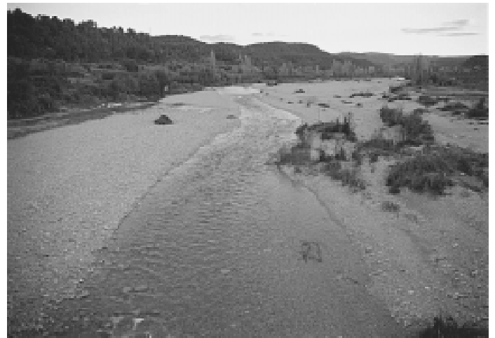
Tram del riu Matarranya on es vol construir el pantà la Freixneda-la Torre del Comte

Les previsions de l'Administració són que el projecte del pantà de la Freixneda-la Torre estigues redactat a primers de