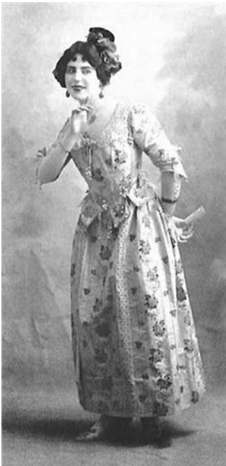
Elvira de Hidalgo interpretant a Rosina

Miguel Fleta, amb qui va compartir repartiment en el Teatre Colón de Buenos Aires i en el Teatre Reial de Madrid. La veu d'Elvira de Hidalgo es considera com a soprano de coloratura, destacava per la seua agilitat vocal, pels seus tons aguts i cristal·lins, la seua dicció perfecta i la seua musicalitat», explica en una nota l'Asociación de Amigos de la Música.