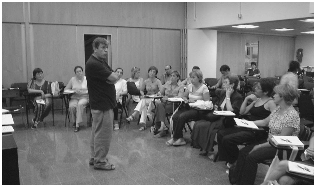
Seminari per a joves compositors

Aquest esdeveniment internacional s'ha celebrat enguany a Barcelona del 18 al 27 de juliol. Més de 3.500 persones entre cantaires, directors i corals que provenien d'Europa, Amèrica, Xina, Japó, Israel, Rússia, Moldàvia, Marroc... i de tants altres llocs de tot el globus, van gaudir d'uns dies carregats de bona música vocal.