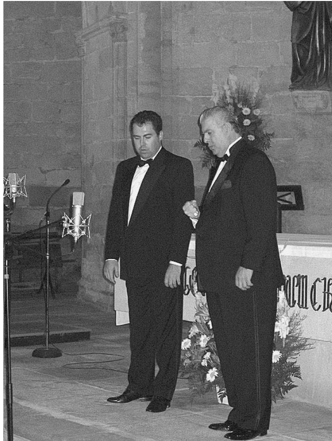
Un moment de l'actuació de l'Homenatge a Elvira de Hidalgo celebrat a Vall-de-roures