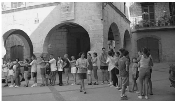
Xiquets jugant a la plaça d'Horta de Sant Joan