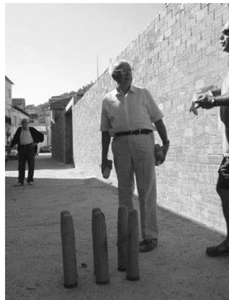
Jornada del Festcat celebrada a Calaceit

Com diu el programa de mà del Festcat 2003: «El curs de jocs tradicionals d'Horta de Sant Joan intensifica la seva implicació amb el territori a través d'una celebració amb l'Ajuntament de Bot i de diversos treballs de camp a altres localitats de la Terra Alta i el Matarranya».