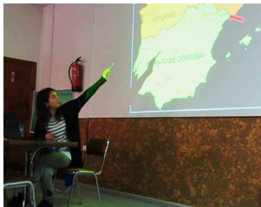
Jornades culturals a Peralta de la Sal