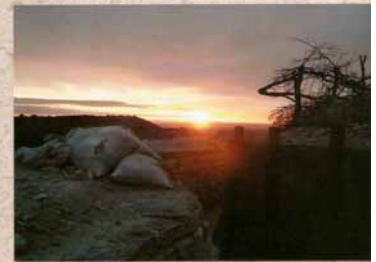
Avanzada en Monte Irazo, Alcubierre.

mavera i el paisatge ha canviat. Orwell resulta ferit al coll i es trasllada a Barbastro, Montsó, Lleida, Tarragona i Barcelona. La situació a Barcelona s'està tornant perillosa per als membres del POUM. Orwell decideix finalitzar la seva participació a la guerra i demana un certificat de llicència basant-se en la seva baixa mèdica.