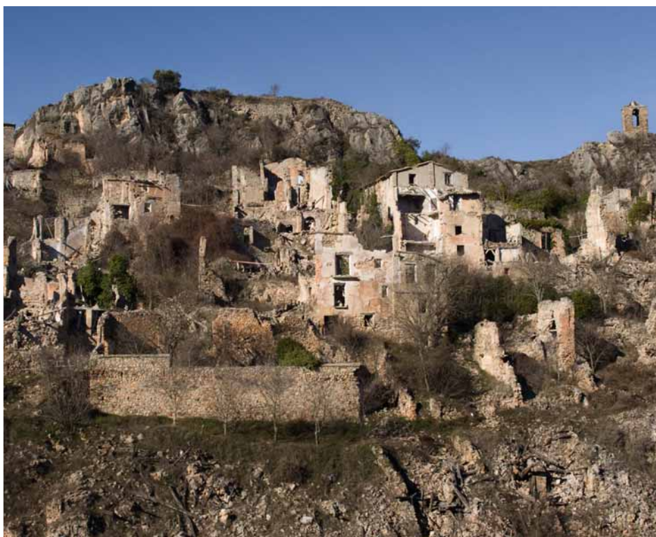
Casserres