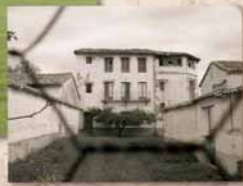
La Granja, Montfort.

sorgir d'una experiència docent al Institut Joan Boscà de Barcelona l'any 2007. La intenció era retre un homenatge a qui ens el va fer a tots nosaltres, setanta anys abans.