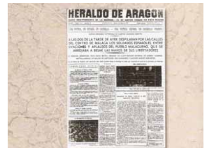
Ejemplar del Heraldo de Aragón del 3 de febrero de 1937 que Orwell menciona en el llibre.