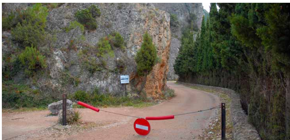
Accés al Parrissal RAMON ROYO

Una vegada passat el mes d'abril es valorarà l'experiència i es decidirà si s'ha de continuar aplicant o cal modificar-la en algun aspecte, per tal d'estendre la seua aplicació a l'altre