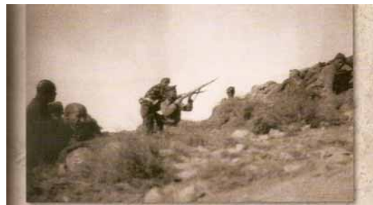
En las trincheras de Alcubierre, 1937.

A les «Notes sobre la edició il·lustrada d' Homenatge a Catalunya », Fernando Casal exposa que la idea d'il·lustrar amb fotografies el text, va