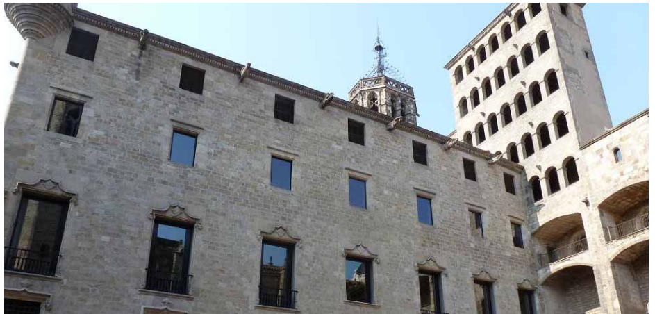
Palau de Lloctinent JOSÉ MIGUEL GRÀCIA

Els documents per a l'estudi del regnat de Pere el Gran que es troben a la secció de Cancelleria de l'Arxiu de la Corona d'Aragó són 36 registres, 565 pergamins, 48 cartes reials i uns quants processos. Quant a les fonts narratives coetànies, destaca el Llibre del rei en Pere d'Aragó e dels seus antecessors passats , de Bernat Desclot.