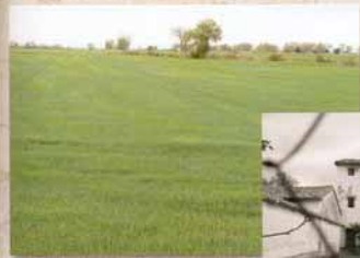
Primavera en Montfort.

Los archivos de Antonio Escartín y Manuel Benito, las fotografías de Manuel Choy, la hemeroteca de Zaragoza y una visita a las trincheras de Monte Irazo ilustran las vivencias que relata Orwell.