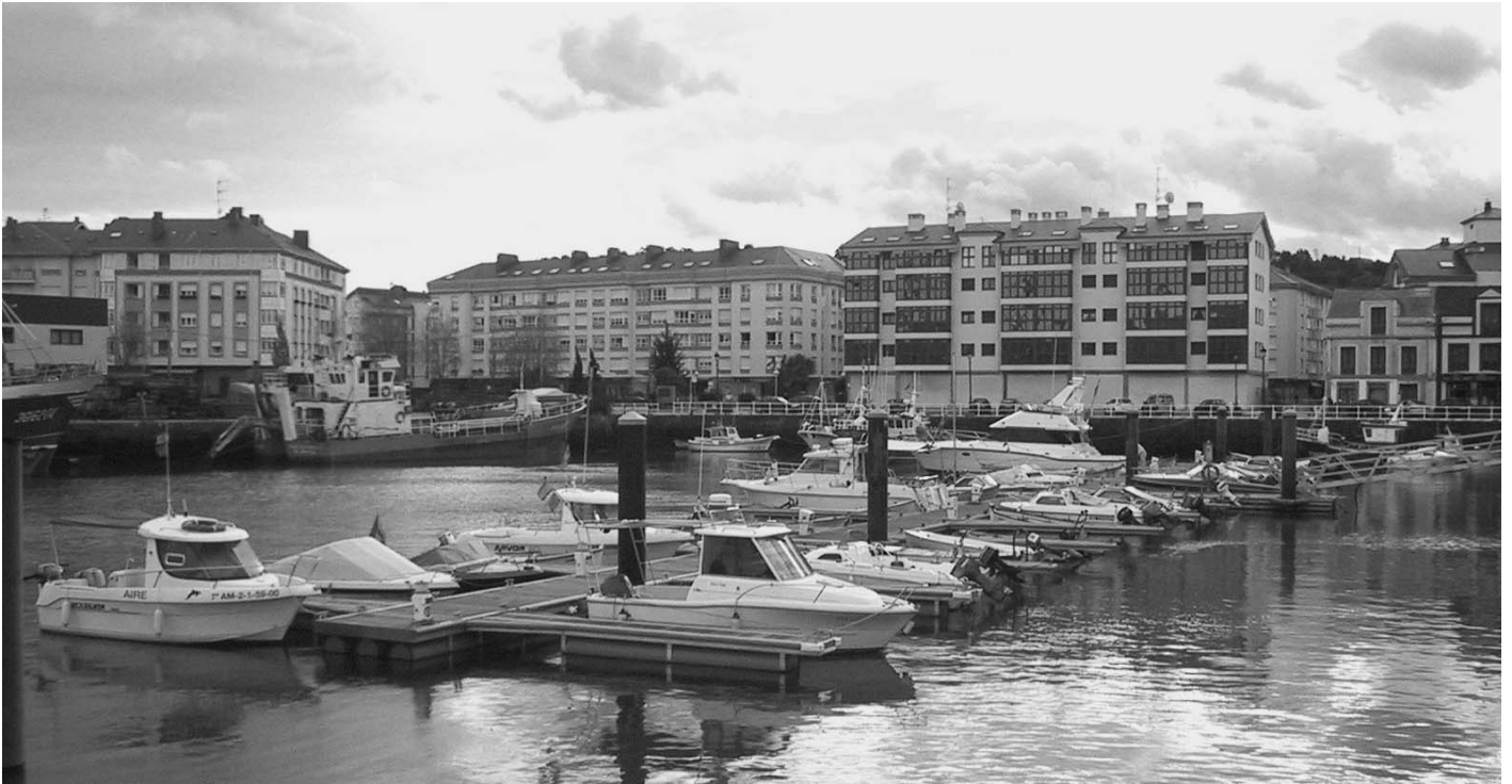
Vista general de la Vila de Navia

El món és ple de franges lingüístiques. Generalment són territoris llargaruts amb una llengua diferent a la de la resta de la seva comunitat administrativa, però que coincideix amb la de la comunitat veïna.