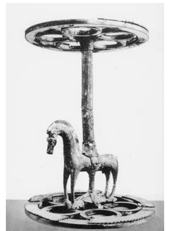
Canelobre de bronze trobat el 1905 a Calaceit

desenvolupats en la història de l'arqueologia espanyola, com l'excavació completa o parcial dels jaciments protohistòrics tan coneguts com Sant Antoni i el Tossal Redó de Calaceit; els Castellans de Queretes; Sant Cristòbol, Escondines Altes, Escondines Baixes i Piuró del Barranc Fondo de Massalió; Torre Cremada de la Vall del Tormo; la Gessera de Caseres; la Tallada de Casp i nombrosos sepulcres i túmuls funeraris de les conques del Matarranya i l'Algars.