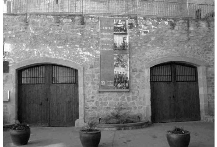
Edifici que acull el Centre de Memòria Històrica a Valljunquera

L'espai, que té l'accés per la plaça del Sitjar, consta de tres grans sales: dos habilitades per a l'exposició permanent i una tercera per a exposicions temporals. En la primera sala tenim diferents apartats temàtics on es convinen de forma prou adequada i didàctica les fotografies ampliades, els dibuixos i els textos escrits pel periodista Josep Pucho. Entre els apartats temàtics destaquen: una cronologia de la Història de la Fotografia, l'album del Matarranya, el cicle de la vida, festes i celebracions, el tren de la Val de Zafan, el pantà de Pena, els personatges il·lustres i els retrats. En el centre de la sala un ordinador i una impressora per a visualitzar i fer còpies de l'arxiu fotogràfic de les quasi 3.000 imatges del Matarranya recopilades, des de les primeres fotografies fins a la dècada dels 60.