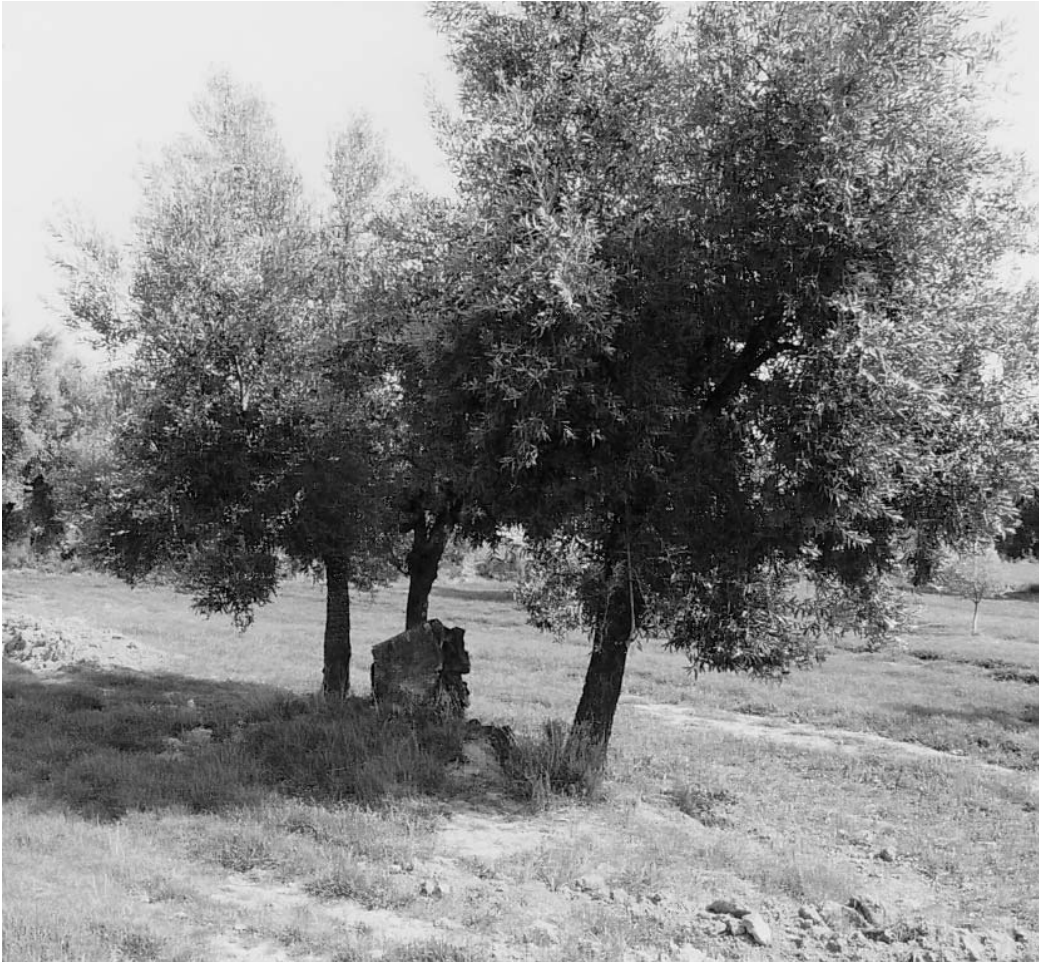
Estat dels olivers actualment

de 1956 no te comparació amb cap altra a la memòria col·lectiva del Matarranya, en desencadenar la pitjor crisi econòmica i demogràfica de tot el segle XX. La baixada dràstica de les temperatures es va produir per l'arribada de dues borses successives d'aire siberià. Quan la primera –que va arribar el dia