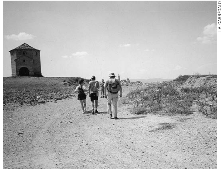
Ermita de Sant Gregori a Aiguaviva