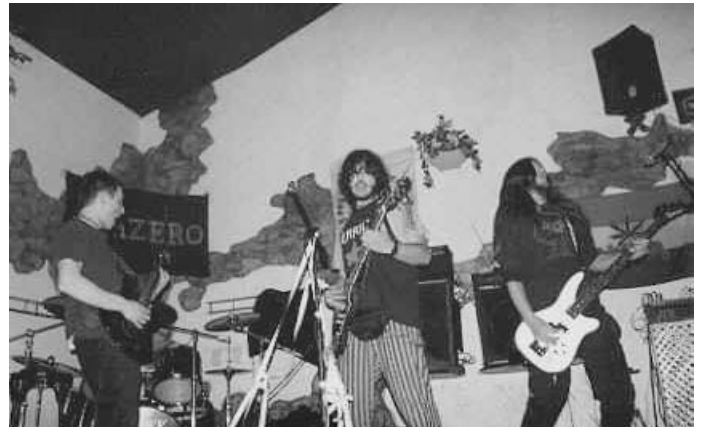
Actuació dels Azero de la Codonyera

El dia 19 de gener vam tornar a viatjar cap a LO CLUB de La Codonyera, allí vam gaudir del què, sens dubte, va ser una de