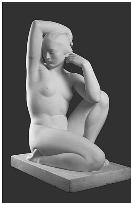
Obra de Pau Gargallo, Acadèmia , 1933

fa molta il·lusió comentar el número 45 de la Revista Nova , de 31 de desembre de 1916. Ens trobem en la portada un magnífic dibuix de Pau Gargallo. És un dibuix senzill, però molt pensat. Una dona jove, nua, amb els cabells llargs, força llargs, ondats i ben pentinats. És agenollada i mou els braços en el començament d'una dansa que esdevindrà etèria. És públicament nua, i per això no pot mostrar-nos tots dos pits totalment, mig d'un s'hi oculta darrera el braç esquerre fins al límit erotogen del mugronet. No permet que la veiem front a front, tanmateix quan s'aixequi i balli, succeirà allò que sembla irremediable. El rostre, d'una bellesa grega i picassiana a la vegada; i tota ella, preludi de la Petita ballarina espanyola de 1927, i encara més, un clar esbós dels cartrons de La gran ballarina de 1929. Sembla mentida, però va trigar tretze anys en començar la dansa, tot i que, dins del cervell de l'artista era ballant permanentment.