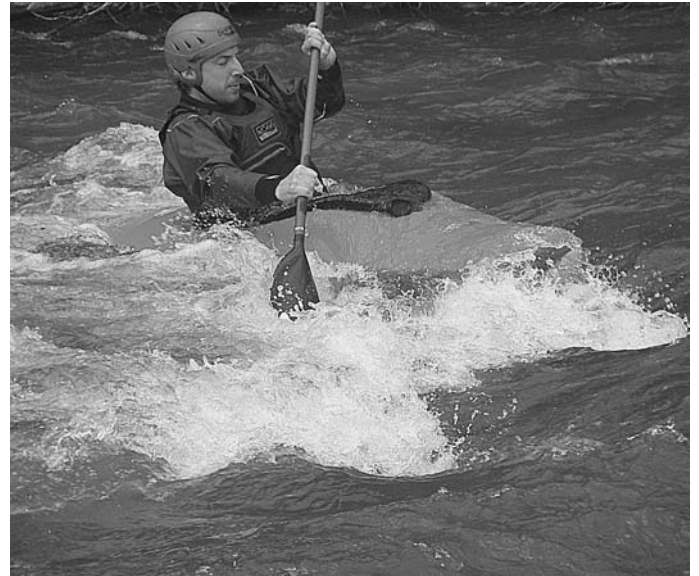
Baixada amb caiac per les aigües del riu Cinca

Quan remo pel Pirineu, en aigües turquesa, veient com les pedres del fons passen molt ràpid davall el casc del caiac, sempre penso en el nostre Cinca, d'aigües brutes i inquietants, amb eixa exuberància biològica que només els caiaquistes podem gaudir en la seua plenitud. I m'entristeix com els riberencs viuen a les seues esquenes, indiferents als plàstics, rodes, ferros, purins i productes tòxics que espatllen la seua figura. Penso en els rius de Txèquia o d'Eslovènia, on