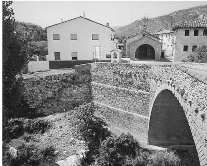
Pont i ermita de Santa Anna a Beseit