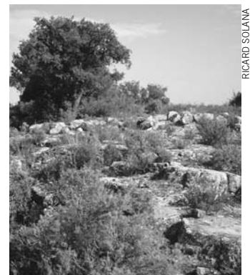
Poblat del Tossal Redó a Calaceit

En les properes setmanes continuarà la instal·lació d'aquests senyals informatius en altres jaciments d'Alcanyís, Calaceit, Casp, Massalió, Oliete, etc. així com la instal·lació de senyals direccionals en els camins d'accés a tots ells.