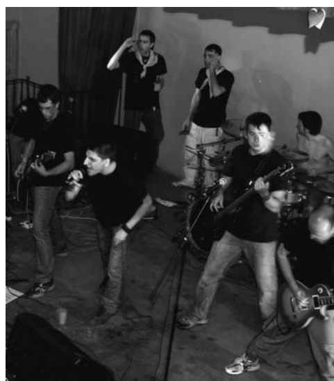
Los Draps van presentar el disc Un crit al vent