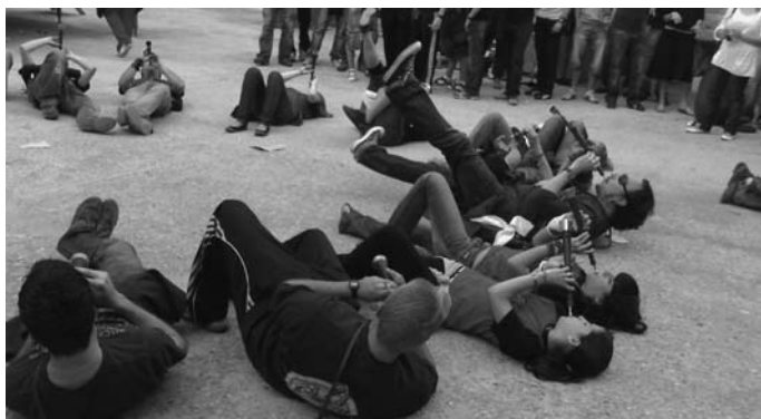
La plaça Major va ser el punt on es van trobar els dolçainers

A les set de la tarda del divendres 16 de maig, mig Massalió mirava al cel i demanava, cadascú a qui creia més adient, que al endemà no plugués. I és que el cap de setmana del 16, 17 i 18 de maig el poble celebrava la I Fira de la Música i la cultura aragoneses.