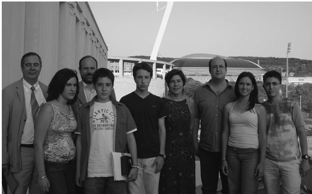
El grup guanyador del premi Baldiri Reixac a Barcelona

El projecte presentat consisteix en un reportatge en format vídeo de 15 minuts aproximadament que explica els principals fets succeïts a la localitat de Fraga durant la primera meitat del segle XX: proclamació de la II República; la Guerra Civil; la repressió i l'exili i els camps de concentració nazis. Per a l'elaboració del guió es van utilitzar una gran quantitat de fonts documentals, entre llibres d'història i articles de revistes. En relació amb el muntatge audiovisual,