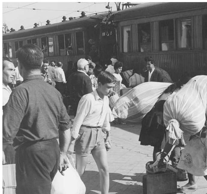
Estació de Móra la Nova l'any 1967

Aquesta tendència, però, s'ha vist compensada per un moviment anàleg vers Barcelona —i en menor grau a València i Madrid, i darrerament a Lleida—. El fet que molts originaris de la Franja s'hagin traslladat al Principat a fer estudis superiors ha tingut una transcendència cabdal per al desvetllament cultural de la Franja, i, en concret, caldria destacar l'important paper que ha adquirit la nova universitat de Lleida en atraure, per raons òbvies de proximitat, molts franjatins. Ben sovint molts habitants de la Franja han adquirit consciència de la peculiaritat cultural pròpia en contactar a Barcelona amb el món de la cultura catalana; aquest va ser, per exemple, el cas de l'escriptor Jesús Moncada, qui en una entrevista a la revista l'Avenç declarava: «La prosperitat [de Mequinensa] se'n va en orris bruscament l'endemà de l'ar-