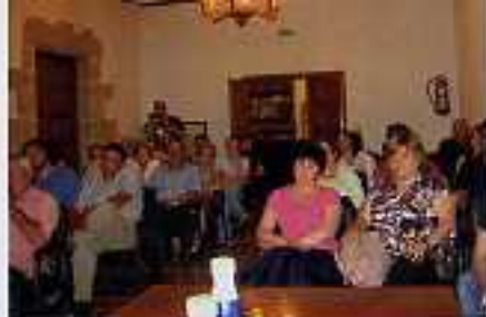
II Fira a Massalió La música i la cultura aragoneses van estar presents a aquesta vila amb un nombre creixent d'assistents.