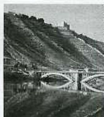
Riu Ebre al pas per Mequinensa

Per totes aquestes raons, des de Convergència Democràtica de la Franja se sol·licita que no es concedeixi l'autorització administrativa d'execució de