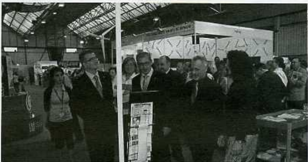
Inauguració de la fira Mercoequip de Fraga

Els passats dies 15, 16 i 17 de maig va tenir lloc a Fraga la XXI edició de la fira Mercoequip. La fira que representa tots els sectors econòmics que formen part de la comarca del Baix Cinca. El sector del comerç i serveis, amb un 46%, era el més representat en aquesta fira, seguit dels serveis agrícoles amb un 17%, les associacions amb un 16%, les empreses d'agroalimentació amb un 14% o el sector de l'automoció amb un 7%. Tots aquests sectors estaven representats mitjançant els 107 expositors que integraven l'edició d'aquest any, 13 menys que en l'edició anterior. Tot i que el nombre d'expositors s'ha reduït, el comitè organitzador de la fira assegura sentir-se molt satisfet ja que són conscients de l'època de crisi que estem travessant.