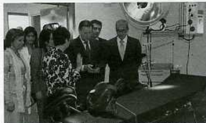
Marcelino Iglesias i la consellera de salut a la inauguració del nou centre

El president del govern d'Aragó, Marcelino Iglesias i la consellera de Salut, Luisa Maria Noeno, van inaugurar, el passat dia 8 de maig a Fraga, el nou centre sanitari d'alta resolució Baix Cinca. El nou