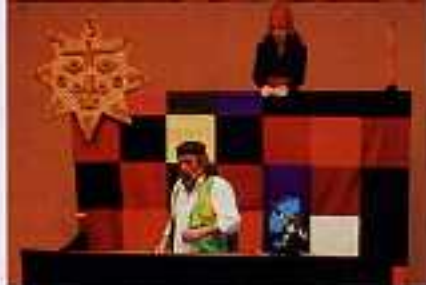
Trencaclosques al Matarranya El grup valencià de música tradicional actua davant de públics diversos a Massalió, Queretes i Calaceit.