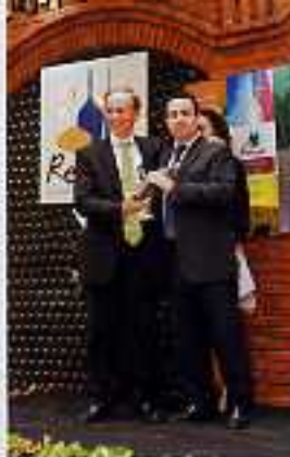
Lliterans de l'any Més de 400 persones van assistir al lliurament dels Premis als Personatges Llitera 2009.