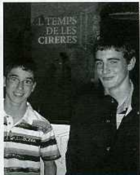
Alumnes IES R.J. Sender finalistes de Ficcions